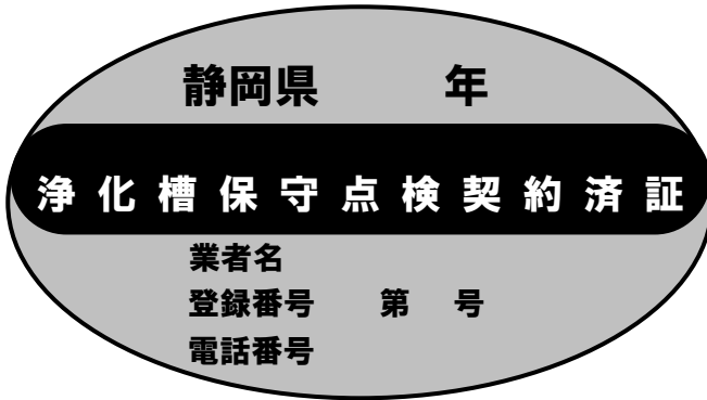
例示様式第 1 号（浄化槽保守点検契約済証）

寸法 直径 5 cm 短径 3 cm の楕円 材質 耐水性の材質 表示 白地に青文字（浄化槽保守点検契約済証の文字は青地に白文字）