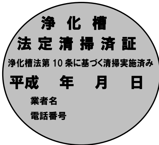
例示様式第 2 号（浄化槽清掃済証）

寸法 直径 5 cm 短径 3 cm の楕円 材質 耐水性の材質 表示 白地に青文字（浄化槽保守点検契約済証の文字は青地に白文字）